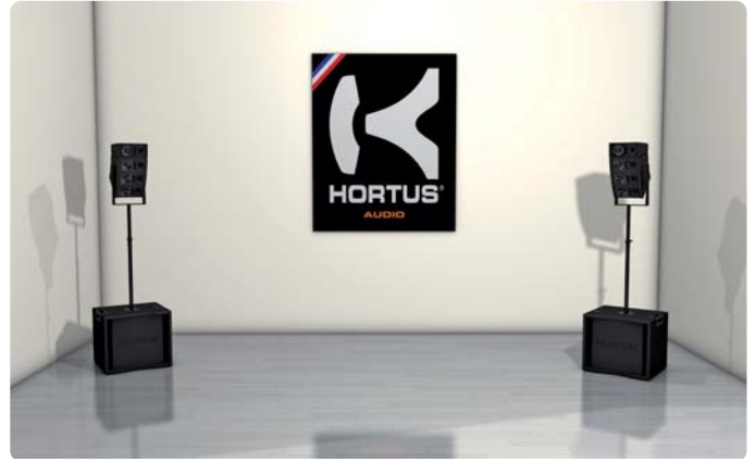
CBA-10M/S : Amplifiés mono ou stéréo + DSP intégré