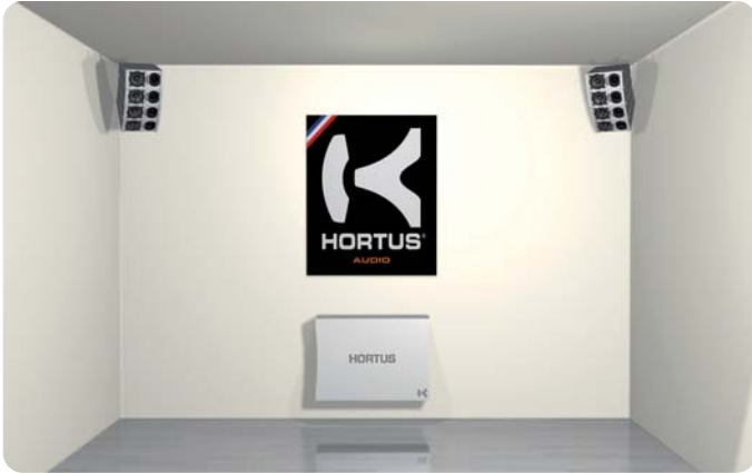
MIB-08S : Amplifié 3 voies avec DSP intégré