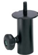
EU-01424 (4) - Embase pied ø35 mm noire