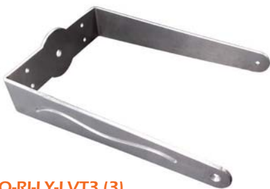
HO-RI-LY-LVT3 (3) - Lyre aluminium pour fixation murale ou sur tube avec adaptateur EU-01424