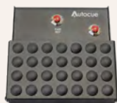
Pédale de commande