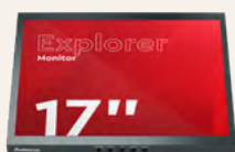
Moniteur Explorer 17"