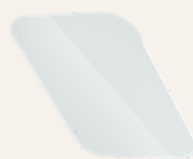
Vitre de conférence