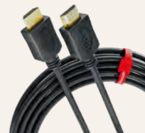
Câble HDMI, 10 m